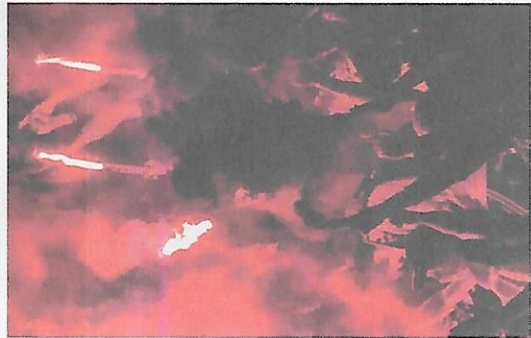
OP. E. RADIKALIZÁCIA A NÁSILNÝ EXTREMIZMUS