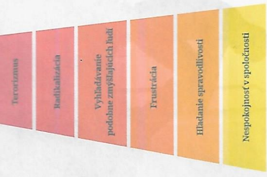
10 | RADIKALIZÁCIA A NÁSILLNÝ EXTREMIZMUS